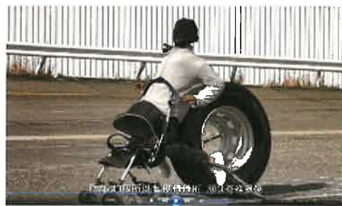
車輪脱落事故啓発動画より (R2. 国交省作成)